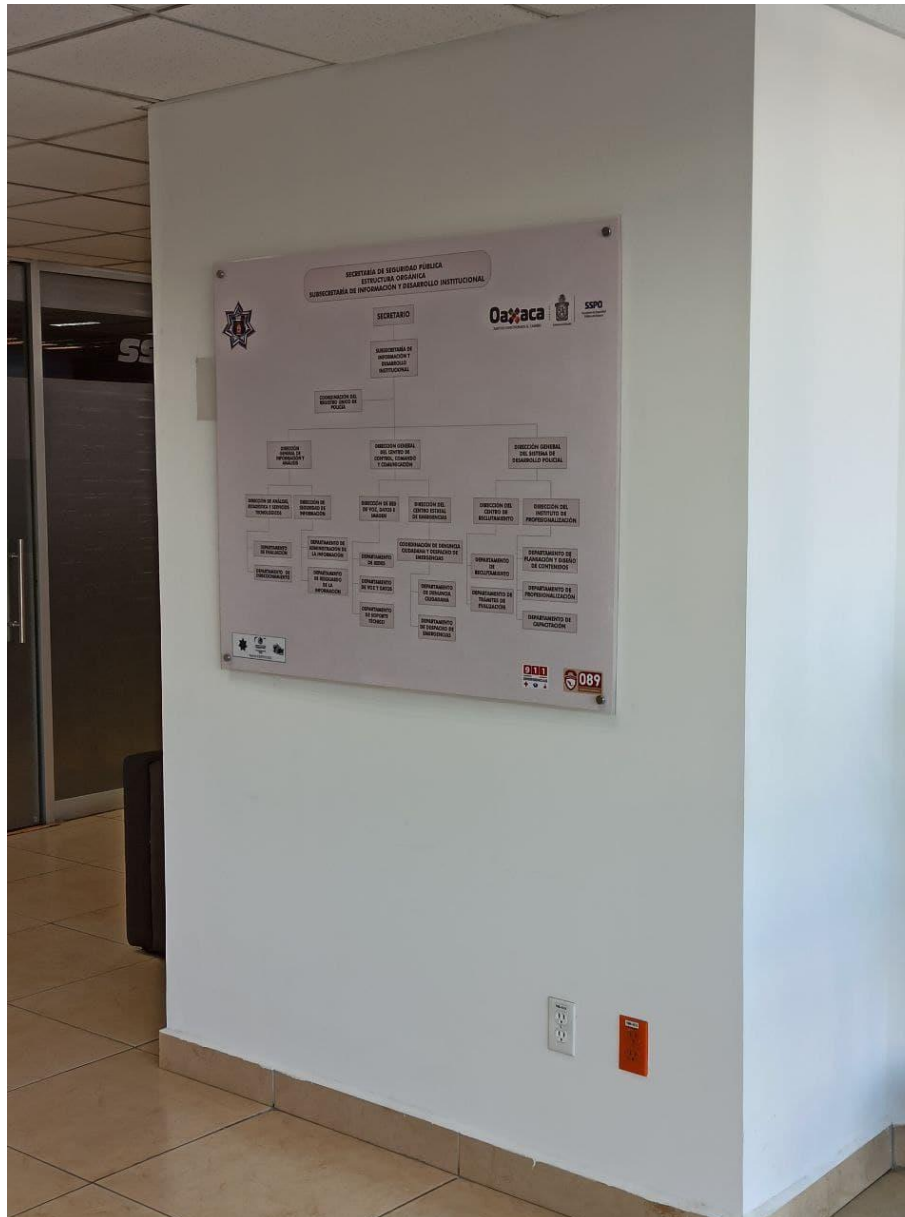
EVIDENCIA DE LA VISUALIZACIÓN DEL ORGANIGRAMA VIGENTE EN LA ENTRADA PRINCIPAL DEL EDIFICIO QUE ALBERGA AL C4 VIGENCIA 20166- 2022