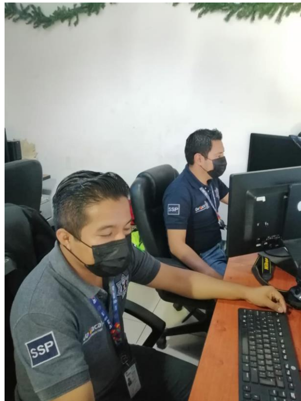
EVIDENCIA INCISO B) FOTOS DEL PERSONAL DE DIFERENTES ÁREAS DEL C4 PORTANDO CREDENCIAL INSTITUCIONAL.