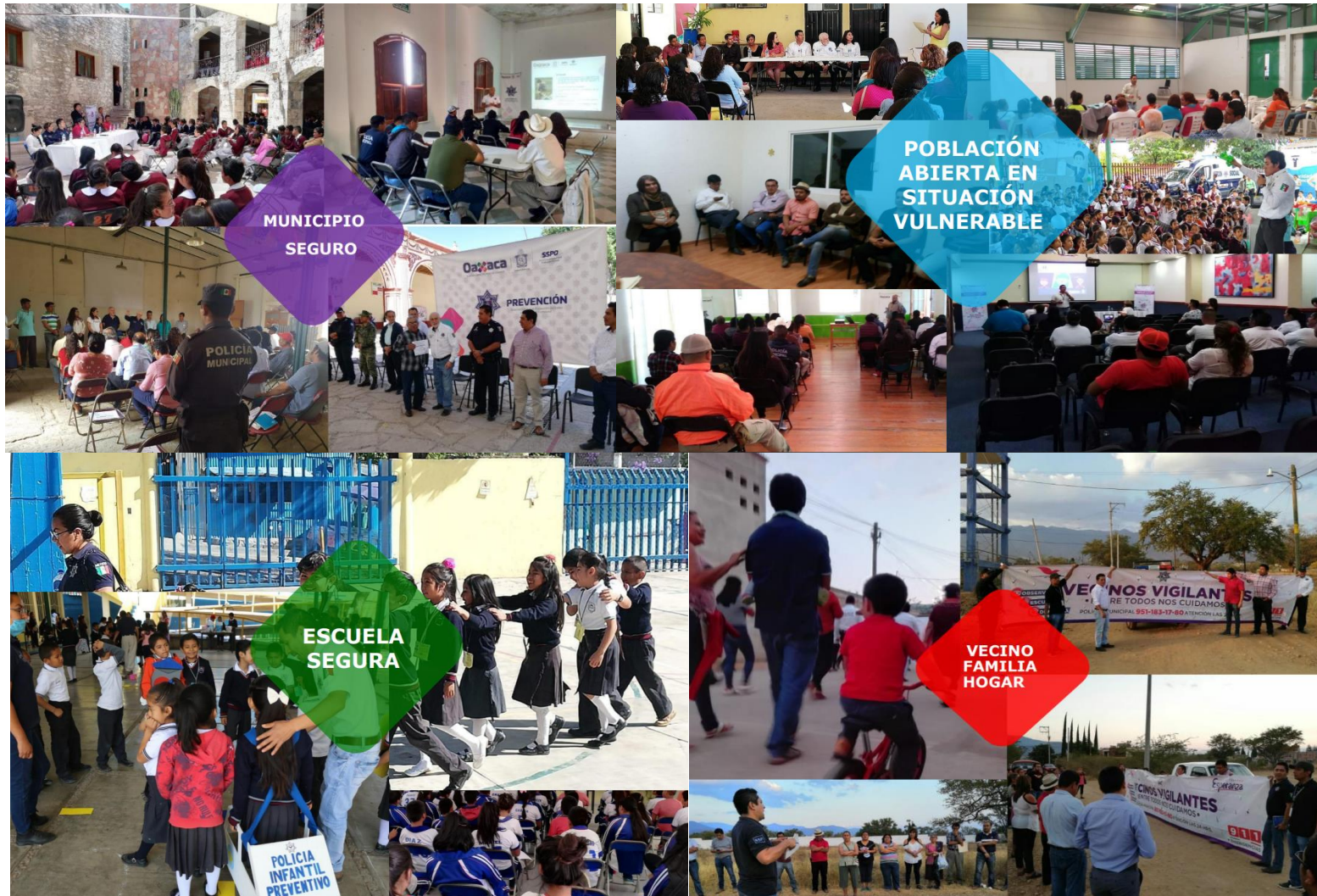
Evidencia inciso "B" Programas y acciones para fomentar de la Dirección General de Prevención del Delito y Participación Ciudadana.